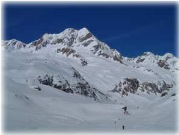
Il Sustenhorn dalla Voralpreuss

Accesso stradale: da Como si segue l'Autostrada Chiasso-Lugano-traforo del Gottardo. Superato il tunnel si esce per Goschenen. Non imboccare la deviazione per Andermat ma entrare nel paese di Göschenen, quindi seguire l'indicazione a destra per la Göschener Tal. In inverno questa stradina è chiusa dopo poche centinaia di metri (Q 1150m), in primavera viene aperta fino alle baite a Q1319 dove si dirama la valle di Voralp, quindi a Giugno viene definitivamente aperta fino alla diga del Göscheneralpsee (ampio parcheggio, Q 1797m).