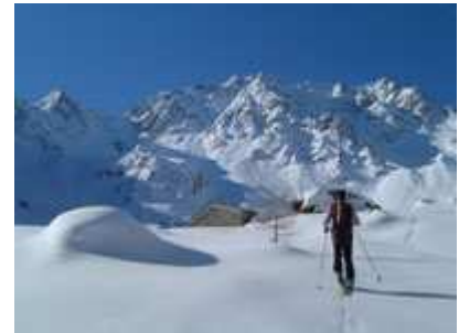
Nei pressi della malga Caronella A sx il canale del Monte Torena

Accesso stradale: da Sondrio proseguire verso Tirano per pochi chilometri fino all'altezza di San Giacomo, dove si oltrepassa a dx la ferrovia dirigendosi quindi a Carona. Parcheggiare in un piccolo spiazzo appena prima delle ultime case del paesino, o appena oltre all'inizio della salita. Meglio avere le catene a bordo. Percorso: passate le case di Carona si segue la strada innevata fino alle baite Prà di Gianni (1339m), da cui inizia il pianone. Attraversato il torrente si tocca Prà della Valle (1363m), e si prosegue superando una seconda volta il torrente fino all'inizio dei boschi. Ora si riprende a salire per il sentiero a tornanti lungo un ripido salto, al termine del quale il terreno si fa più aperto raggiungendo Malga Caronella (1858m).