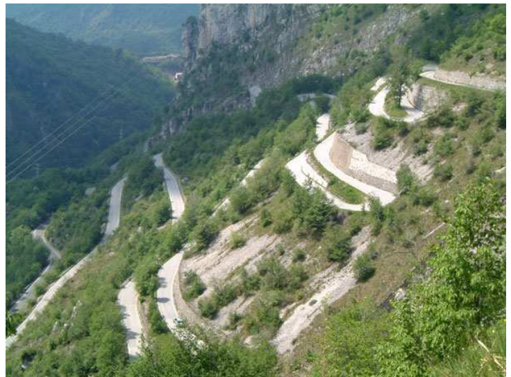
La salita di Morterone

Cartografia: KOMPASS n°91 1:50.000 - Lago di Como Lago di Lugano; KOMPASS n°105 1:50.000 - Lecco, Valle Brembana; Le Grigne Resegone di Lecco e Legnone 1:35.000 ZetaBeta.