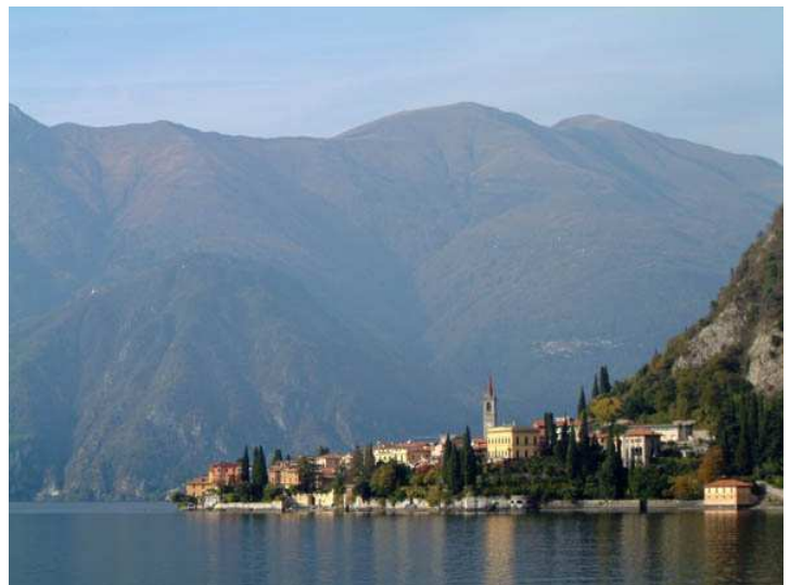
Scorcio su Varenna

Quota max: 320m - Dislivello tot: 1000m Sviluppo: 160km