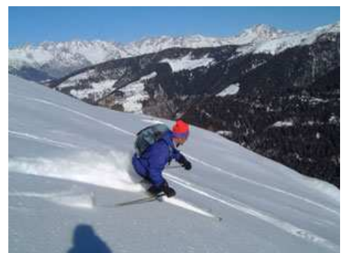
Discesa all'Alpe Vesenda