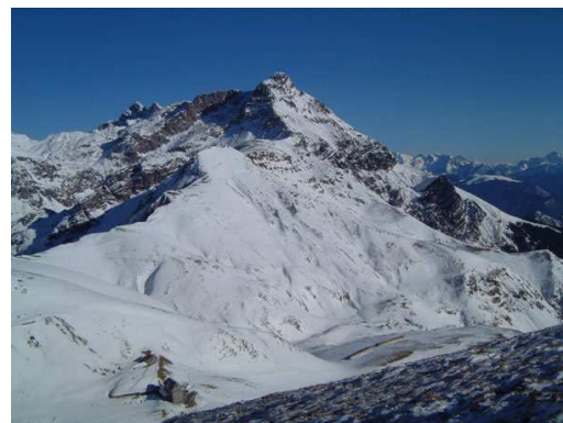
Rif.Grassi e Pizzo dei Tre Signori dallo Zuc di Valbona

Bella gita poco conosciuta e scarsamente frequentata. La prima parte si svolge sulla strada per Biandino, sciabile e divertente. Il bosco fino al Rif. Pio X è un po' fitto, ma poi la sciata è garantita.