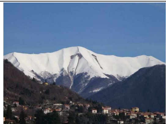
Versante sud del M.San Primo da Sagnino (CO)

Breve gita al centro del Lario. Con buon innevamento si possono combinare varie discese e risalite sui costoni dalla cima. Con bel tempo la vista panoramica su tutte le montagne del Lario è garantita.