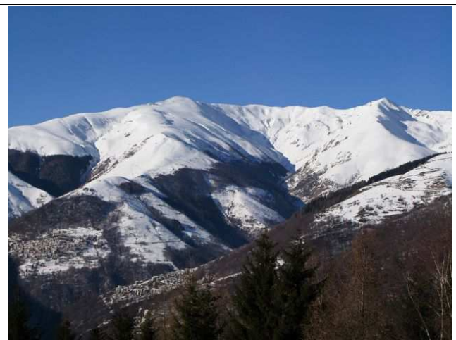
A destra la dorsale del Monte Lungo dal Marnotto

Bella gita semplice e generalmente sicura, si svolge interamente su una ampia dorsale con dolce pendenza.