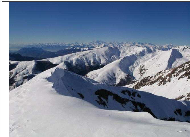
In centro la dorsale del Monte Lungo dalle Pianchette