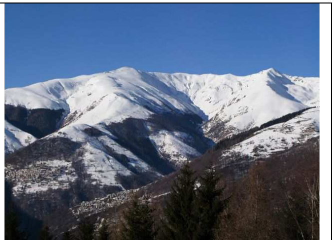
a sx la cresta che sale dal Passo San Lucio alla Garzirola

Gita molto semplice e praticamente priva di pericoli poichè si svolge su una ampia dorsale con dolce pendenza praticamente costante.