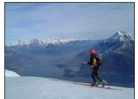
Vista sul Lario e Valtellina sotto la cima del Bregagnino