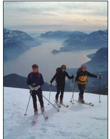
Salita dai Monti di Breglia