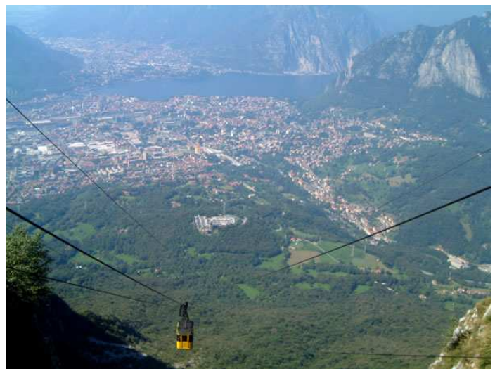
Vista su Lecco dai Piani di Erna

Quota max: 1330m - Dislivello tot: 1300m Sviluppo: 30km