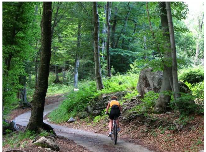
Sulla ripida cementata verso il Rif.Pianezzo

Quota max: 1220m - Dislivello tot: 1100m Sviluppo: 43km